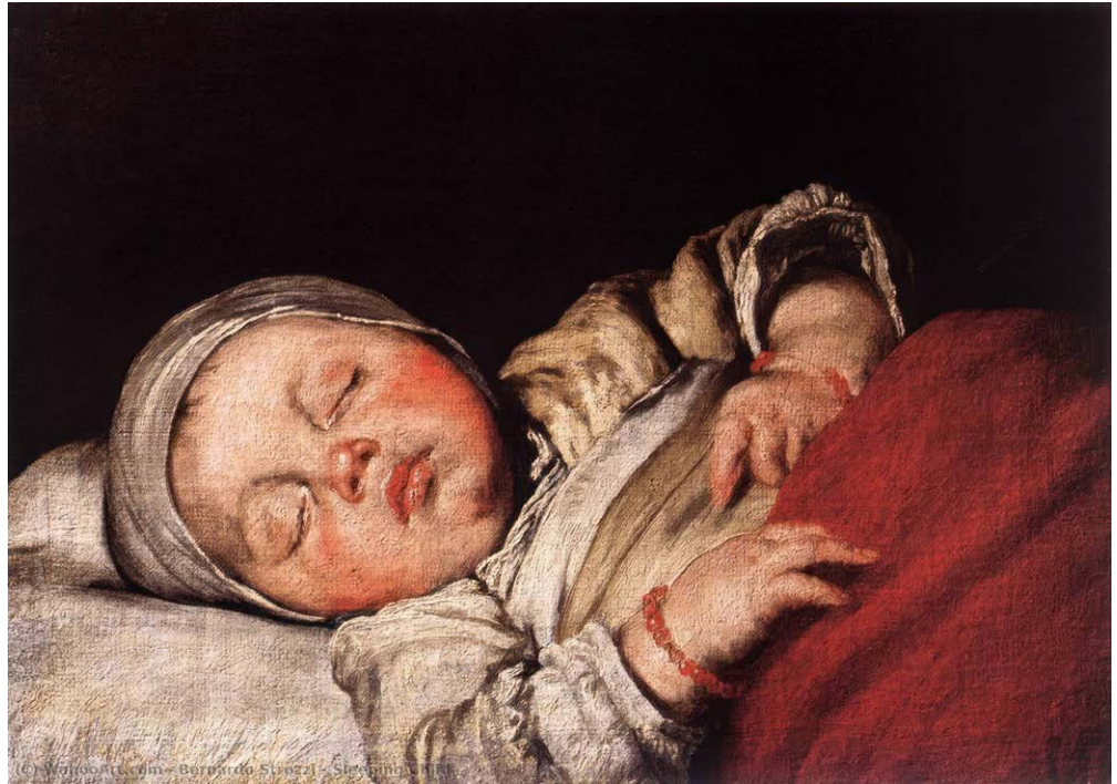
Criança dormindo Bernardo Strozzi (1581-1644) – Óleo sobre tela

No que se refere ao setting terapêutico, quando lidamos com experiências relacionadas aos primórdios da mente,