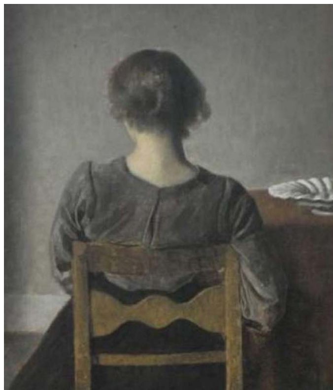
Descanso 1905 – Vilhelm Hammershøi

Esse ambiente suficientemente bom, deve ser capaz de atender às suas necessidades básicas por meio de um objeto cuidador que esteja psiqui-