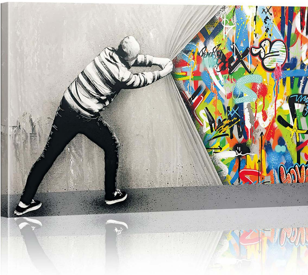
Por trás da cortina Grafite de rua do inglês Banksy