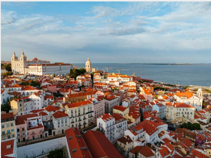
Vista do bairro de Alfama, em Lisboa, e do Rio Tejo

INTERNATIONAL PSYCHOANALYTICAL ASSOCIATION